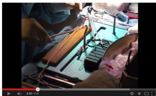
Hamstring ACL Reconstruction Surgery and Meniscus Repair

Onze hardlooptrainers besteden regelmatig aandacht aan het soepel houden en strekken van de hamstrings. Van de meeste spieren weet je wel wat ze doen en waar ze zitten, maar hamstrings?? Nou nee. Wel is algemeen bekend dat je een blessure daaraan beter niet kunt hebben omdat herstel zo lang duurt.